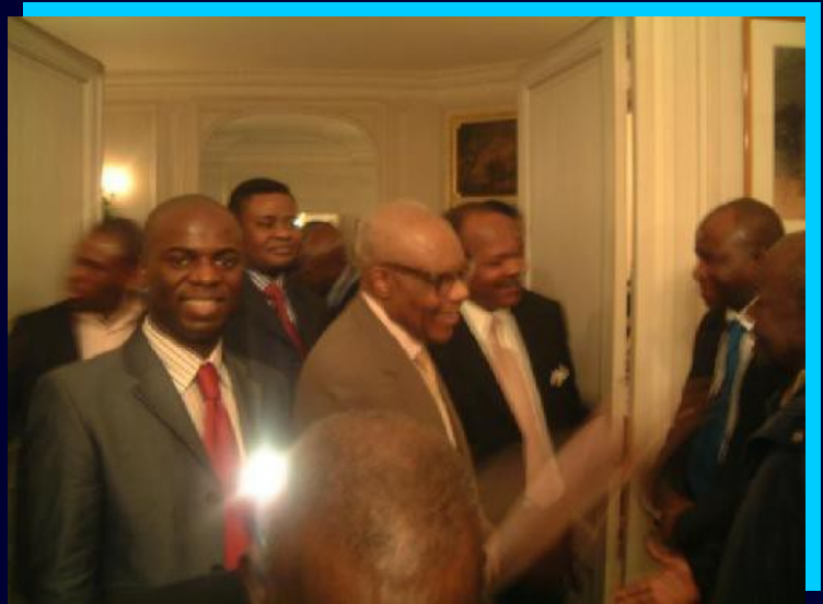
En compagnie du Président Pascal Lissouba