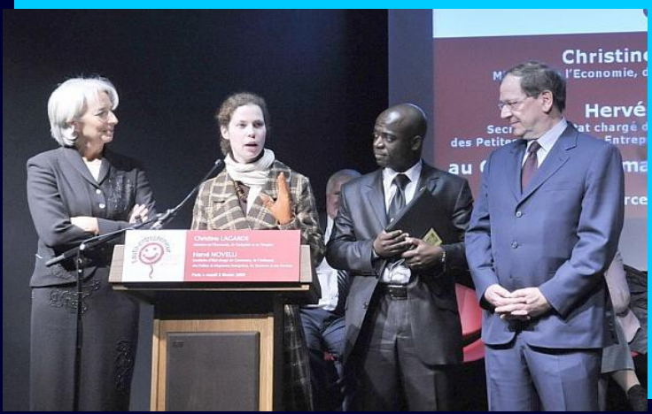
En compagnie de Christine Lagarde