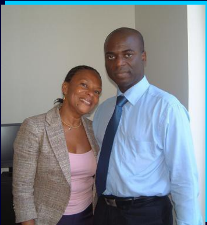
En compagnie de Christiane Taubira