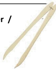
pince à cornichon /