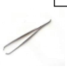
pince à épiler /

Un bac d'eau avec des éléments en suspension (graines de tournesol qui flottent)