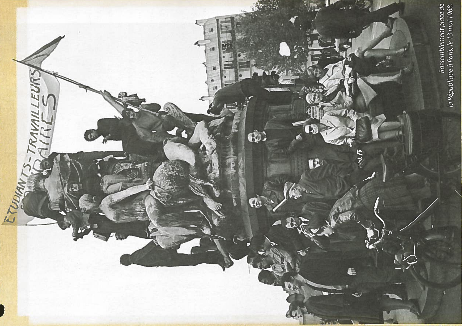
Rassemblement place de la République à Paris, le 13 mai 1968.

Le 22, des étudiants occupent l'université de Nanterre (92). C'est la naissance du Mouvement du 22 mars. La contestation se déplace à Paris.