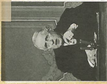
Le général de Gaulle, en 1968.

Le 30 : large victoire de l'UDR (qui soutient de Gaulle) qui obtient la majorité à l'Assemblée nationale.