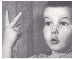
U a 2 doigts en l'air.