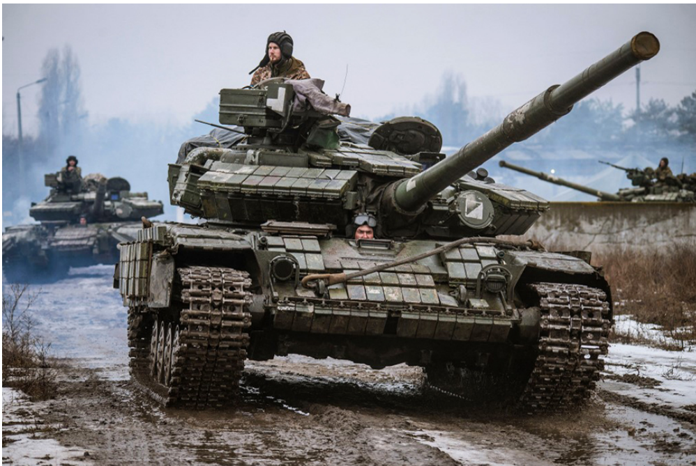
Ces militaires ukrainiens se trouvent dans la région du Donbass, en Ukraine. La photo a été prise le 24 février 2022.

On en parle partout à la radio, à la télé et dans les conversations des adultes autour de toi : après plusieurs semaines de menaces, la Russie vient d'attaquer l'Ukraine. Ces deux pays sont en conflit depuis de nombreuses années, mais les choses se sont accélérées hier. 1jour1actu te raconte ce qui s'est passé.