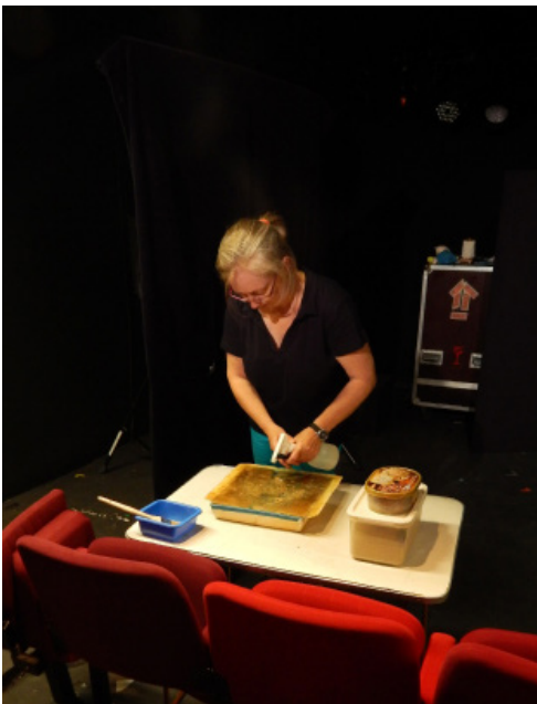
(1) Bien mouiller le support

Temps de réalisation : une quinzaine de minutes.