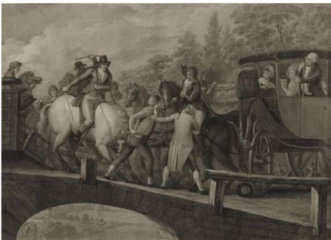
Fuite du roi et arrestation à Varennes