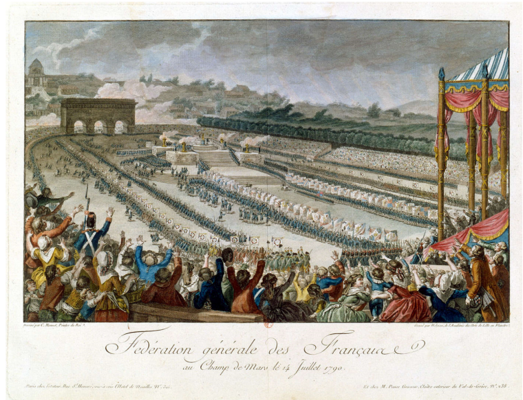
14 juillet 1790, fête de la fédération