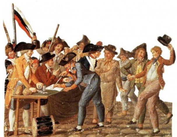
Enrôlement des volontaires 1792