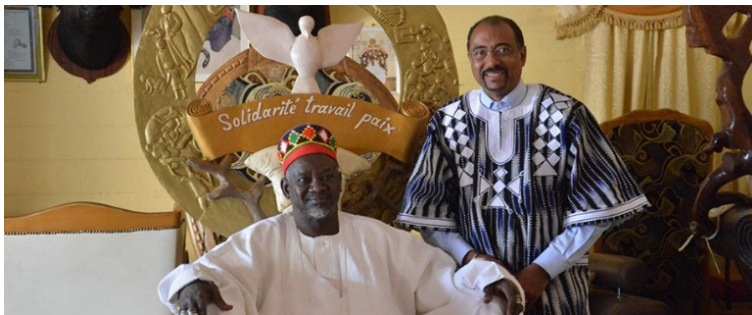
Le Moro-Naba reçoit dans son Palais

24- Qui sont les deux joueurs héros de cette finale ?