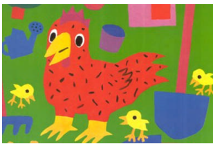
LA PETITE POULE ROUSSE