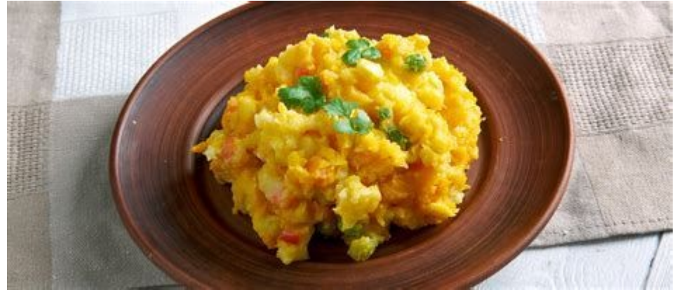
irio kikuyu (pois, PDT, maïs, banane verte)