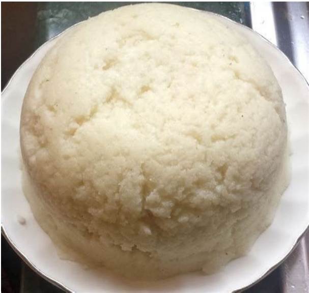
Ugali (purée de farine de maïs)