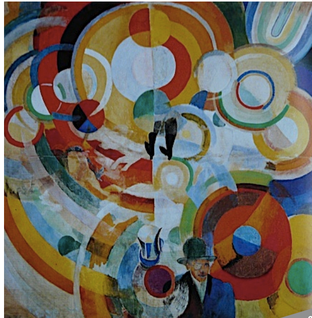
Le manège de cochons

Robert Delaunay est un peintre Français né en 1885 à Paris et mort en 1941 à Montpellier. Il commence à peindre en autodidacte (tout seul) comme Paul Gauguin, Paul Cézanne et Georges Seurat. Il commence à travailler sur le thème de la ville (et en particulier de la Tour Eiffel), au début d'après des cartes postales, puis de la fenêtre de son atelier où il s'installe après son mariage avec Sonia Terk en 1910.