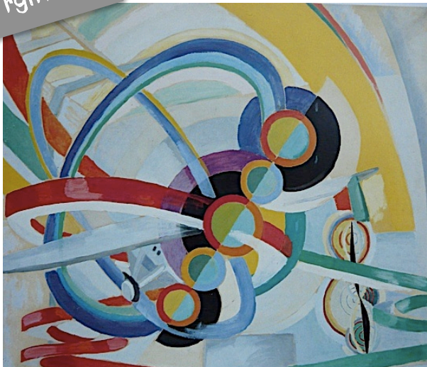
Hélice et rythme