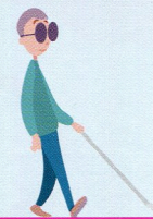
Les malvoyants et non-voyants