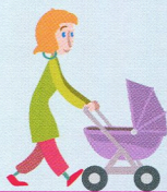
Les parents avec une poussette