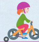
Les cyclistes de moins de 8 ans