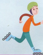
Les personnes à rollers