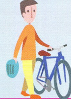
Les personnes qui marchent avec un vélo à la main