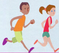
Les personnes qui font du jogging