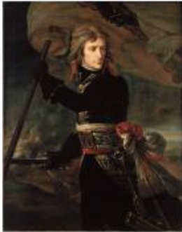
Napoléon lors de la bataille d'Arcole en Italie. Toile d'Antoine-Jean Gros