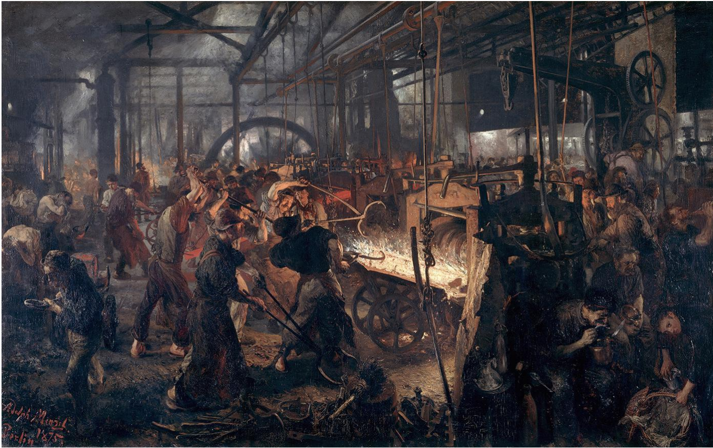
« La forge » par Adolf Friedrich Erdmann Von Menzel, vers 1872-1875

Louis René Villermé (1782-1863) était un médecin français. Il faut les voir arriver chaque matin en ville et en partir chaque soir. Il y a, parmi eux, une multitude de femmes pâles, maigres, marchant pieds nus au milieu de la boue, et un nombre encore plus considérable de jeunes enfants, aussi sales, aussi maigres, couverts de haillons, salis par l'huile qui tombe des machines pendant qu'ils travaillent. Ils portent à la main ou cachent sous leur veste, comme ils le peuvent, le morceau de pain qui doit les nourrir jusqu'à l'heure de leur retour à la maison. Ainsi, à la fatigue d'une journée démesurément longue puisqu'elle est au moins de quinze heures, s'ajoute celle de ces allers et retours si pénibles. Le soir ils arrivent chez eux accablés par le besoin de dormir, et le lendemain ils en sortent avant d'être complètement reposés pour se trouver dans l'atelier à l'heure de l'ouverture. Pour éviter de parcourir un chemin aussi long, ils s'entassaient dans des chambres près de leur travail. Un mauvais et unique grabat pour toute la famille, un petit poêle qui sert à la cuisine comme au chauffage, une caisse ou boîte en guise d'armoire, deux ou trois chaises, un banc, quelques poteries composent le mobilier qui garnit la chambre. Les plus pauvres habitent les caves et les greniers.