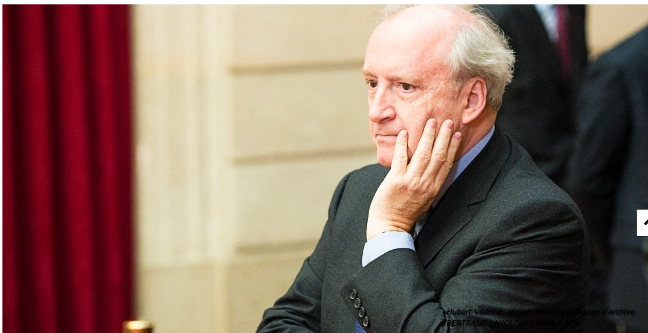
Hubert Védrine, ancien ministre