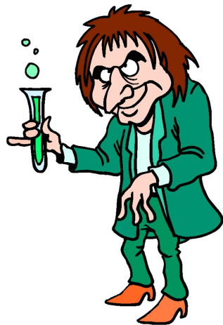
un savant fou