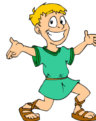
un enfant rusé