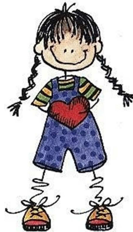
une petite fille