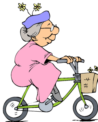
une vieille femme