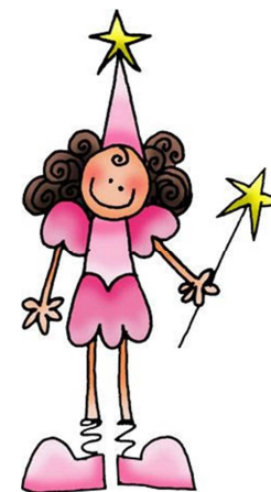
une bonne fée