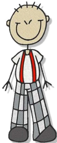
un jeune homme