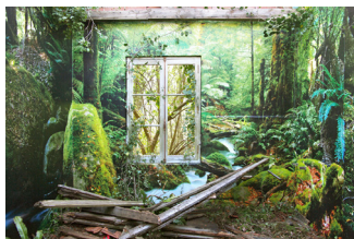
Tanaïs & Entropie : le cycle de la chambre verte / 2010