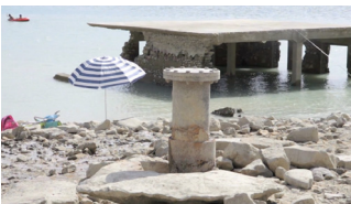
Atlas Oculito / extrait du film documentaire / 2018...