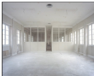
Archéometrie / extrait de l'installation vidéo / 2007