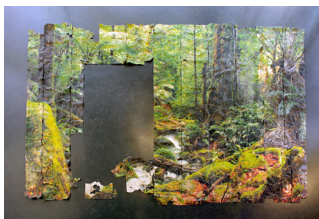
Tanaïs & Entropie : le cycle de la chambre verte / 2010