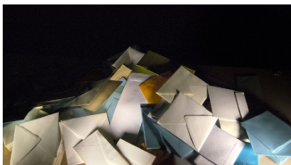
Lettres de Rivesaltes / 2016