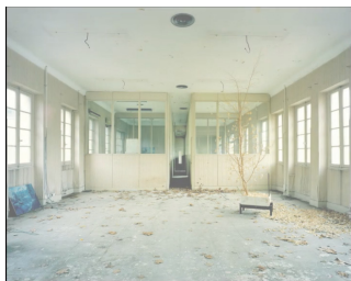
Archéometrie / extrait de l'installation vidéo / 2007