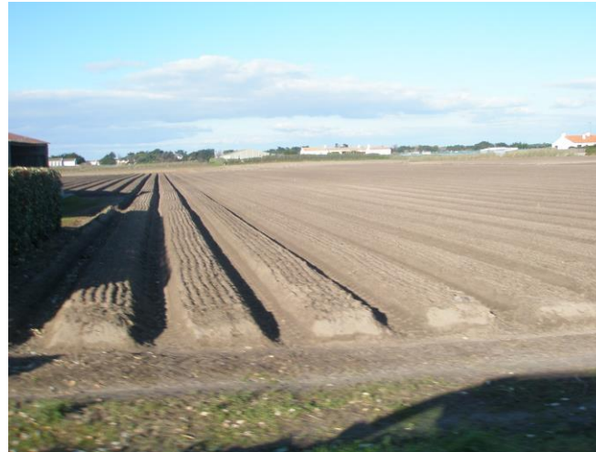
Culture de pommes de terre