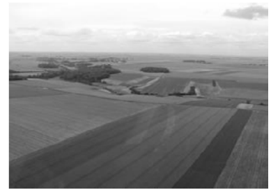
Vue des plaines de la Beauce (Bassin parisien)