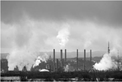
Vue du site de Feyzin (vallée du Rhône)

3. Reliez chacune des photographies à l'espace auquel elle correspond. (1,5 point)