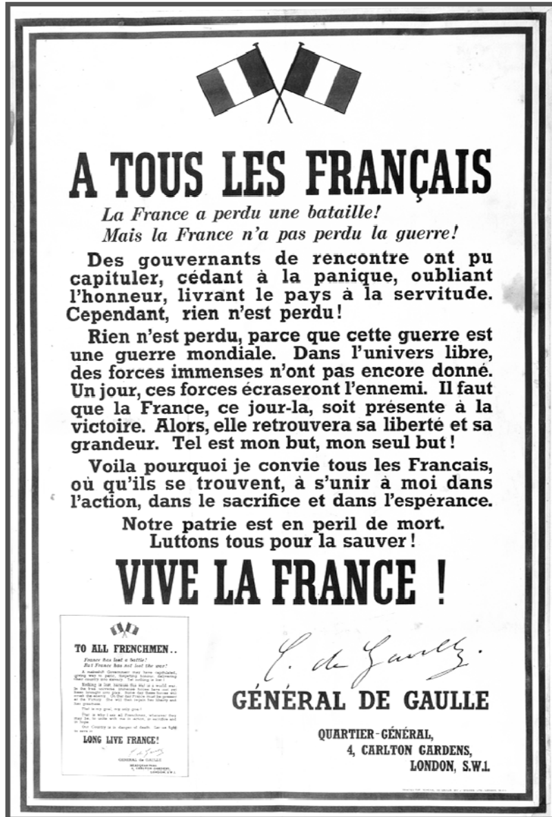
Source : L'histoire par l'image. Affiche publiée en juillet 1940. © Paris - Musée de l'Armée, Dist. RMN-Grand Palais/Pascal Segrette.

1. Nommez l'auteur du message délivré par cette affiche.