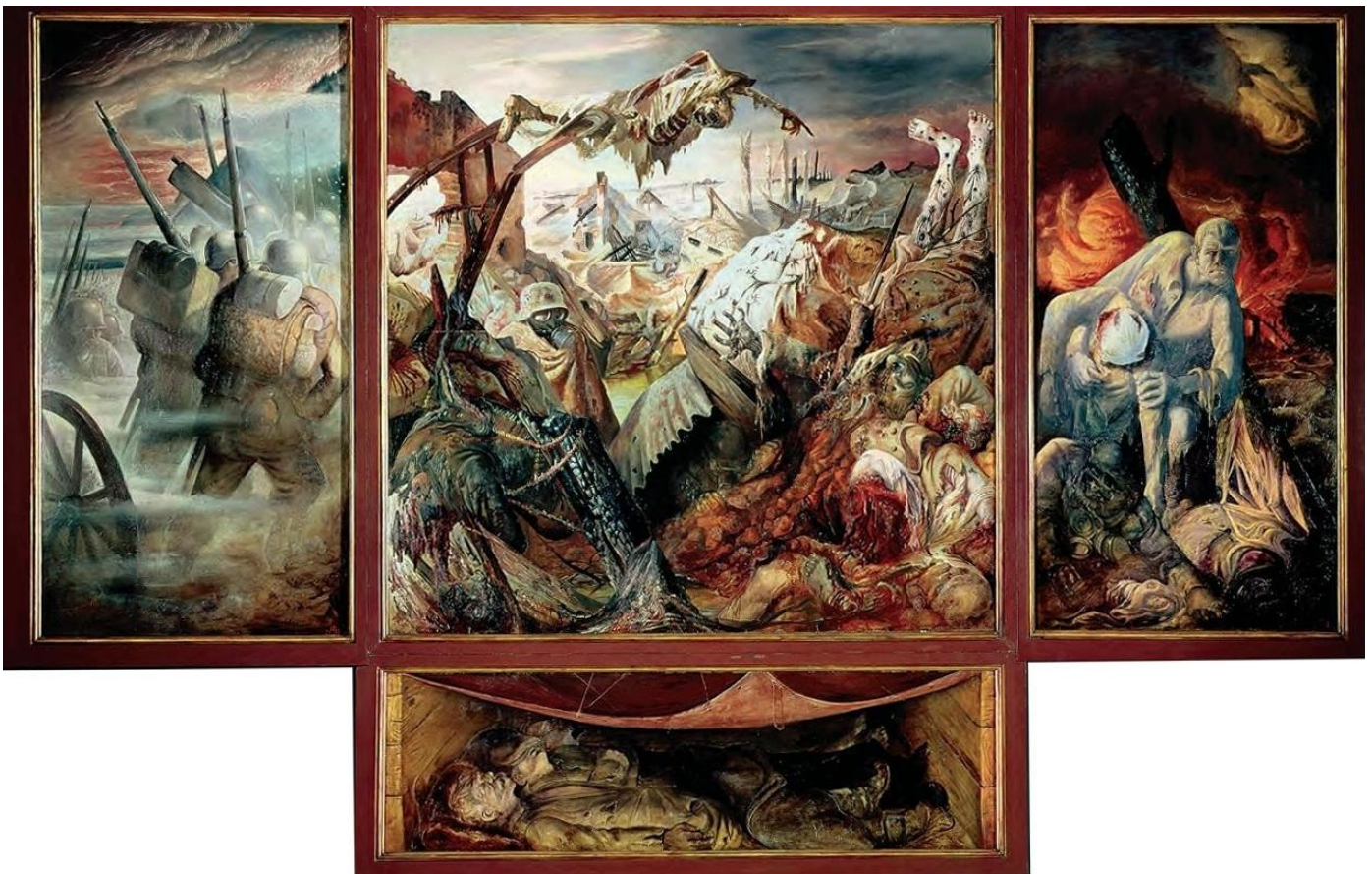
Tableau d'Otto Dix, 1932