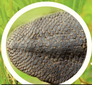
Queue aplatie recouverte d'écailles