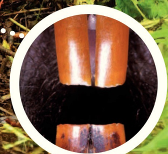
Dents très coupantes