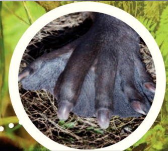
Pattes arrière palmées