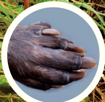
Pattes avant avec 5 doigts munis de griffes