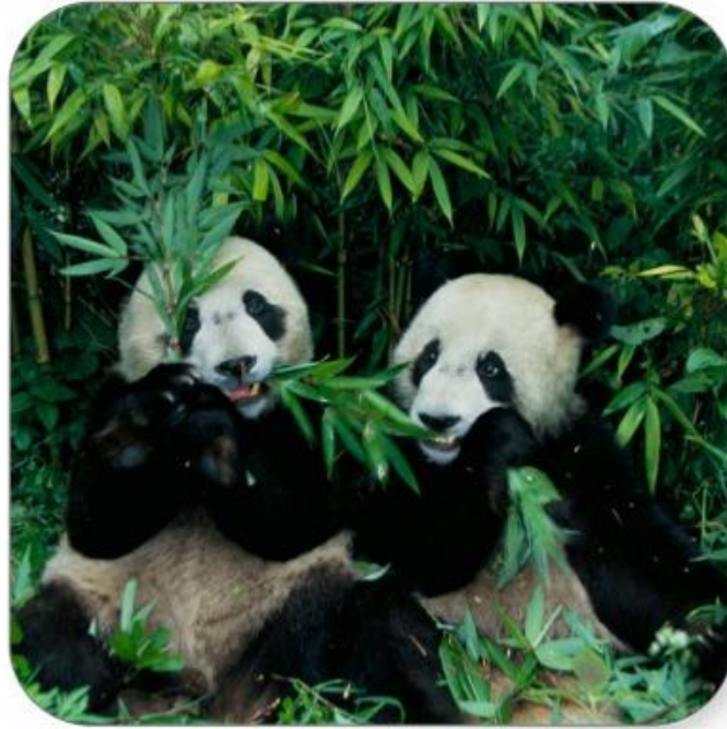
Des pandas dans une forêt de bambous.