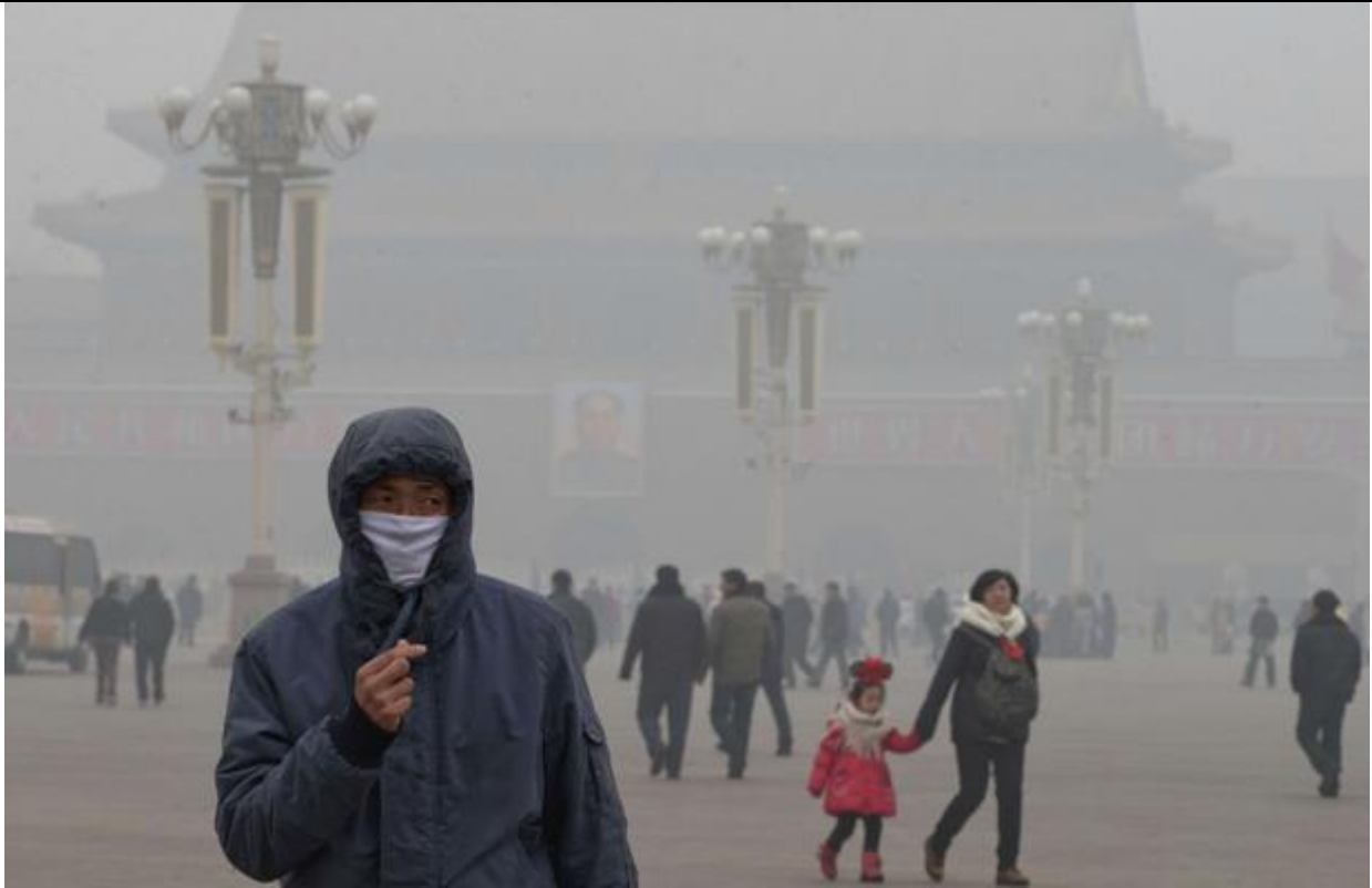
La pollution à Pékin