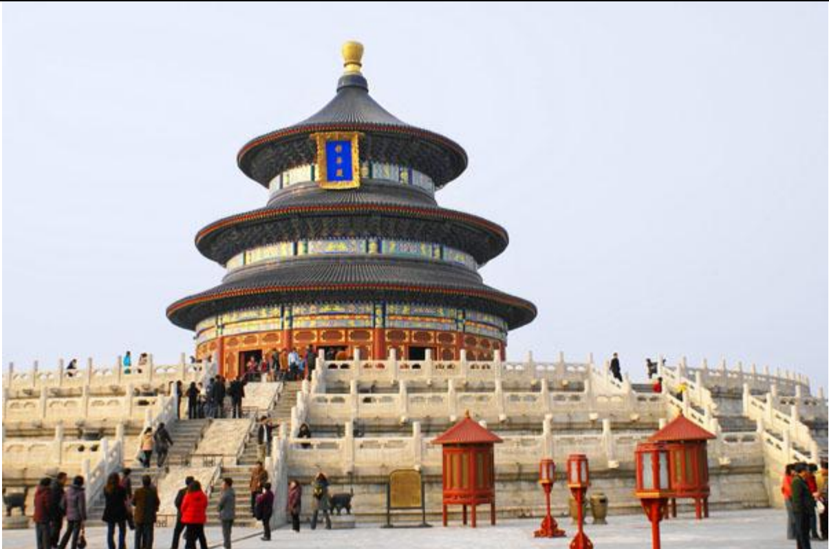
Le Temple du Ciel, à Pékin