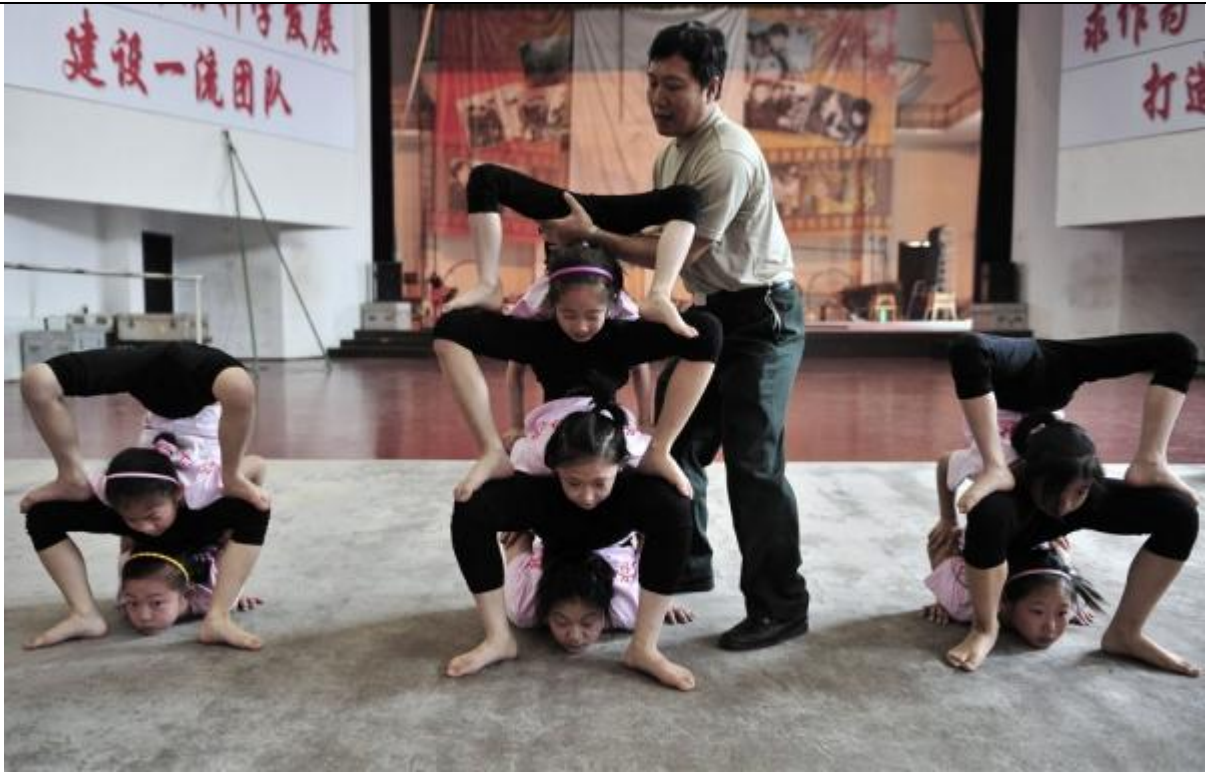
Des enfants acrobates avec leur professeur