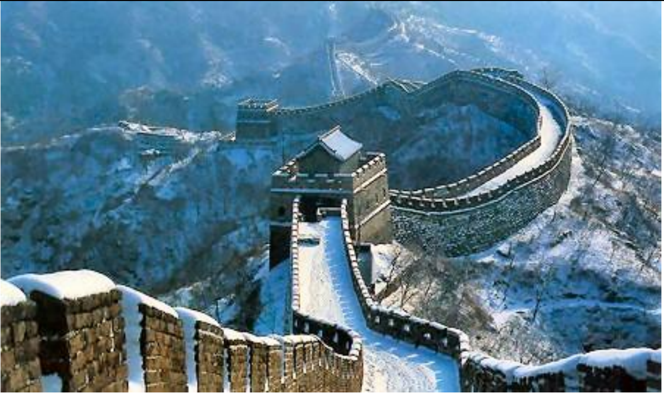
La Grande Muraille sous la neige