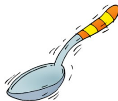
une cuillère à soupe