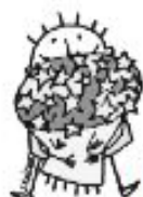
Une journée pour l'Europe

Depuis janvier 2002, dans 12 pays de l'Union européenne, nous payons nos achats avec des pièces et des billets en euro. Ces pays sont l'Allemagne, l'Autriche, la Belgique, l'Espagne, la Finlande, la France, la Grèce, l'Irlande, l'Italie, le Luxembourg, les Pays-Bas et le Portugal.