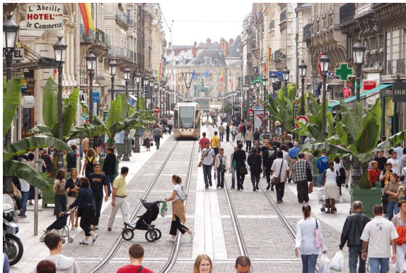
Centre ville d'Orléans