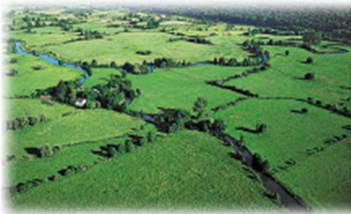
Paysage de Normandie (Bassin parisien)