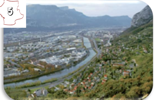
Grenoble dans la vallée de l'Isère