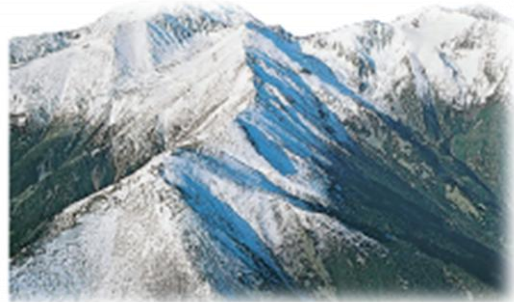
Massif du Canigou dans les Pyrénées