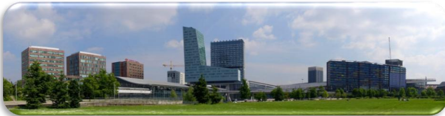
Le centre d'affaires Euralille