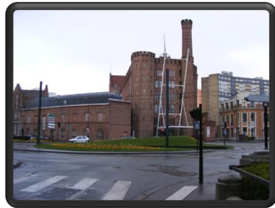
L'Eurotéléport à Roubaix, une ancienne filature reconvertie en Centre international de la communication et des nouvelles technologies.