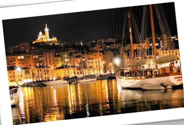
Le port de Marseille