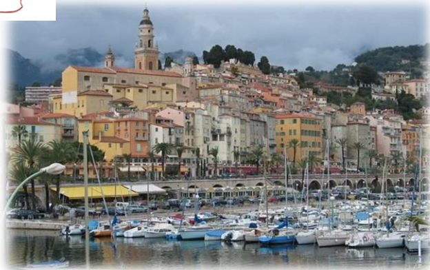
La ville de Menton (Côte d'Azur)