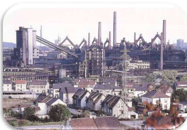
La Ruhr (Allemagne)