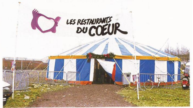
Les restos du cœur, créés en 1985 par Coluche