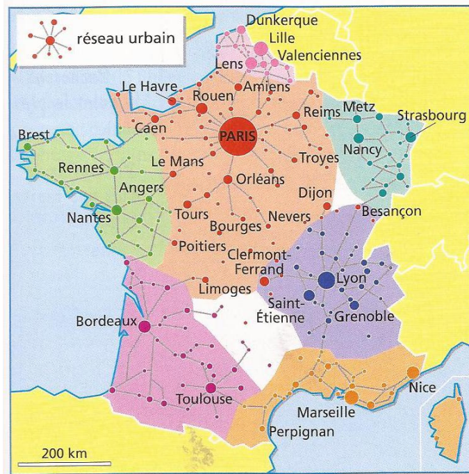
Le rayonnement régional des grandes villes françaises