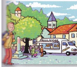
Enfant, Arthur est allé à l'école de son village : Ligeux, 250 habitants.

a- Quelle distance Arthur parcourait-il chaque jour pour aller à l'école ? Au collège ? Au lycée ?