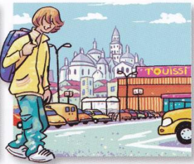
Il est allé au lycée à Périgueux, 30 000 habitants, à 18 km.