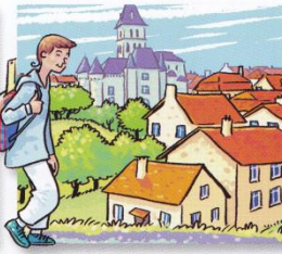
Il est allé au collège à Thiviers, 3 600 habitants, à 17 km.