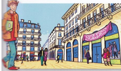
Il a fait des études à l'université de Bordeaux, 760 000 habitants, à 149 km.