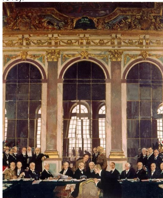
La signature du traité de Versailles (Tableau de W. Orpen, 1919)

Des traités particuliers règlent les questions concernant l'empire autrichien qui est démantelé. On assiste à la naissance de nouveaux états : Yougoslavie, Hongrie, Tchécoslovaquie, Pologne, Lituanie, Lettonie, Estonie aux dépens de l'Autriche, de l'Allemagne et de la Russie. La France reconquiert l'Alsace-Lorraine et s'installe dans la Sarre. L'empire colonial allemand est partagé par les alliés (traité de Versailles en 1919).