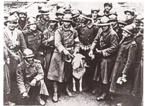
Une unité de tirailleurs sénégalais pendant la guerre

Les forces de l'Axe (Allemagne, Italie, Japon) étendent la guerre partout dans le monde. La guerre s'étend en Méditerranée et en URSS, envahie par l'Allemagne en 1941. Dans le Pacifique, le Japon provoque l'entrée en guerre des États-Unis en bombardant la base américaine de Pearl Harbor. Les colonies européennes d'Asie et d'Afrique sont progressivement touchées par la guerre. Les pays européens font appel aux hommes de leurs colonies pour participer à la guerre.