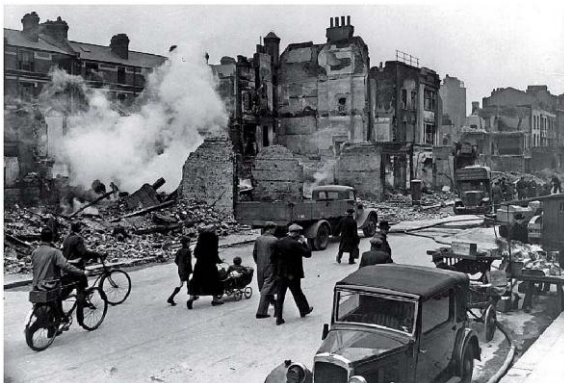
Bombardement à Londres en 1940

Dans les pays occupés, l'Allemagne exerce un véritable pillage financier et humain. Les populations vivent dans la pénurie, la peur des arrestations et des exécutions.