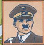
Allemagne Adolf Hitler État totalitaire. Partisan de la guerre.