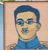
Japon Hirohito Empire totalitaire. Partisan de la guerre.