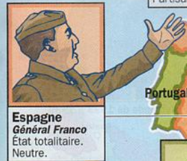
Espagne Général Franco État totalitaire. Neutre.