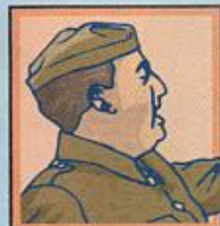
Espagne Général Franco État totalitaire. Neutre.