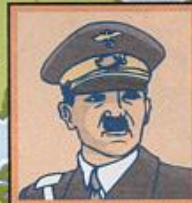
Allemagne Adolf Hitler État totalitaire. Partisan de la guerre.