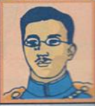
Japon Hirohito Empire totalitaire. Partisan de la guerre.