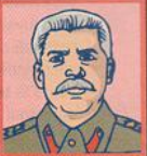
URSS Joseph Staline État totalitaire. Neutre.

URSS (Union des républiques socialistes soviétiques)