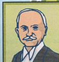
France Albert Lebrun République. Partisan de la paix.