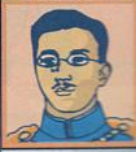
Japon Hirohito Empire totalitaire. Partisan de la guerre.