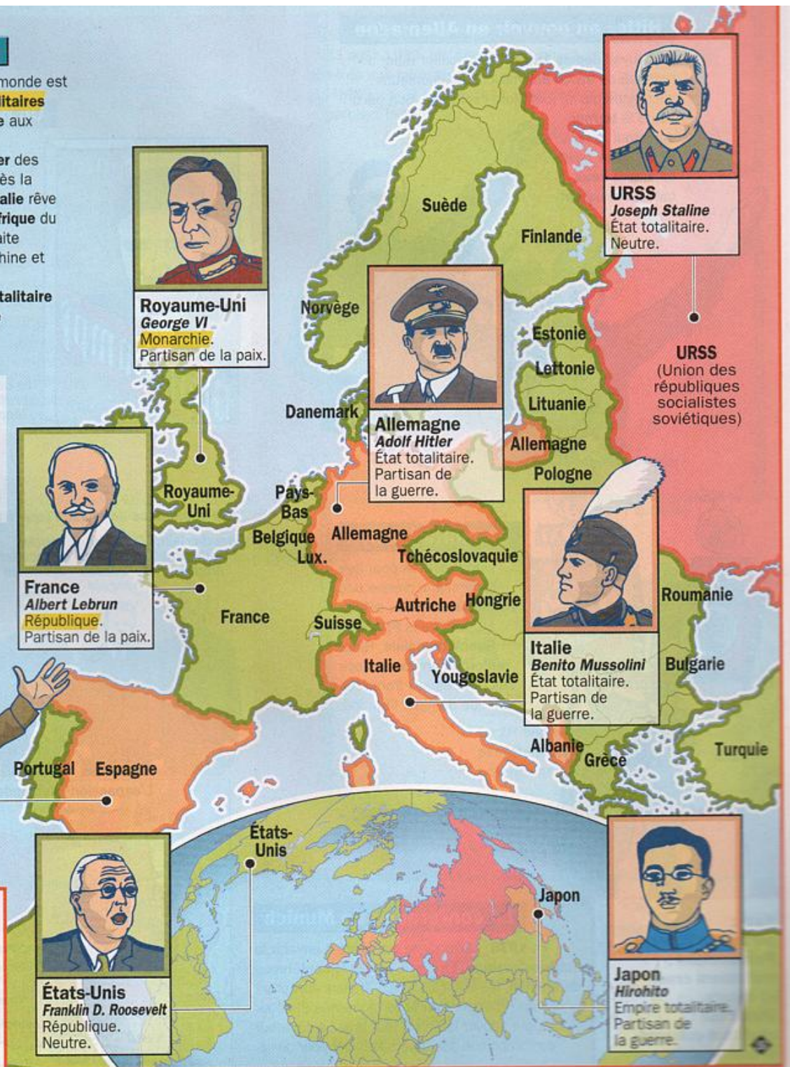
URSS (Union des républiques socialistes soviétiques)

Totalitaire : qui n'accepte aucune opposition et terrorise la population. Monarchie : pays dirigé par un roi. République : pays dirigé par un président élu.