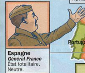
Espagne Général Franco État totalitaire. Neutre.