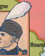
Italie Benito Mussolini État totalitaire. Partisan de la guerre.