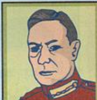
Royaume-Uni George VI Monarchie. Partisan de la paix.