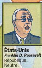
États-Unis Franklin D. Roosevelt République. Neutre.