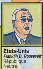
États-Unis Franklin D. Roosevelt République. Neutre.