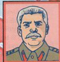
URSS Joseph Staline État totalitaire. Neutre.