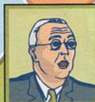
États-Unis Franklin D. Roosevelt République. Neutre.