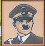
Royaume-Uni George VI Monarchie. Partisan de la paix.