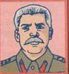
URSS Joseph Staline État totalitaire. Neutre.

URSS (Union des républiques socialistes soviétiques)