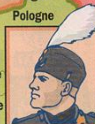
Italie Benito Mussolini État totalitaire. Partisan de la guerre.