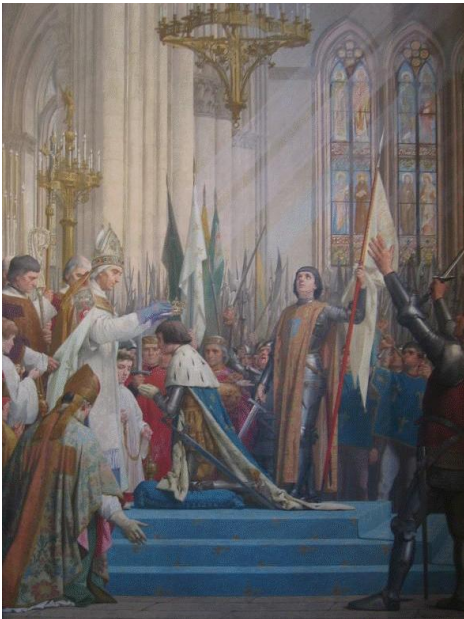
Jeanne d'Arc au sacre de Charles VII, à Reims, le 17 juillet 1429. Tableau de Jules Lenepveu, 1890.

Jeanne d'Arc accompagne Charles VII à Reims où il se fait sacrer. Après le sacre, beaucoup de villes le reconnaissent comme le vrai roi de France. Mais Jeanne échoue devant Paris, puis elle est capturée par les Bourguignons. Ils la vendent aux Anglais qui la font juger et condamner à mort à Rouen. Elle y est brûlée vive le 30 mai 1431.