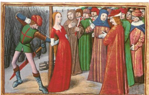
Jeanne d'Arc au bûcher (miniature de 1484)