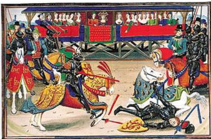
Enluminure du XIVème siècle