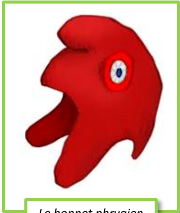
Le bonnet phrygien

Amuse-toi à reproduire le bonnet phrygien sur le quadrillage.