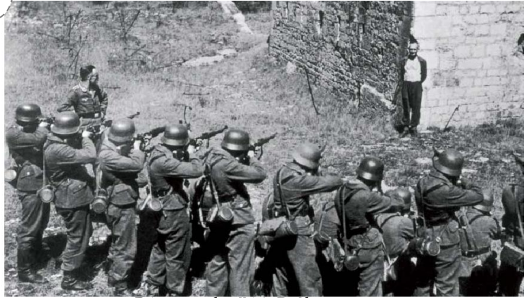
Résistant fusillé à Belfort, 1944.

400 000 français et françaises ont participé à la Résistance. C'est sans doute autant que le nombre de Français et Françaises qui ont collaboré avec les nazis, c'est-à-dire qui les ont aidés en leur fournissant des produits alimentaires et du matériel de guerre, en dénonçant les résistants qui étaient alors arrêtés et fusillés.