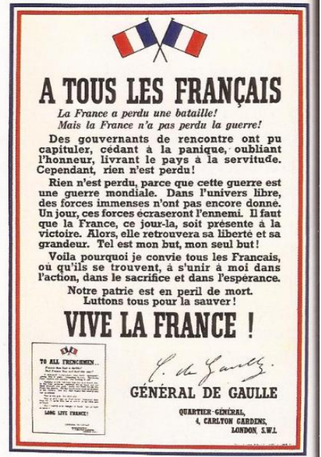
L'appel du 18 juin 1940 du général de Gaulle