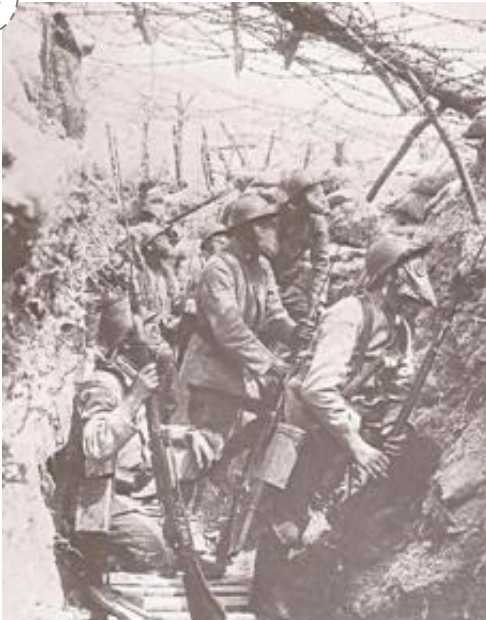
Poilus dans une tranchée entre 1915 et 1918