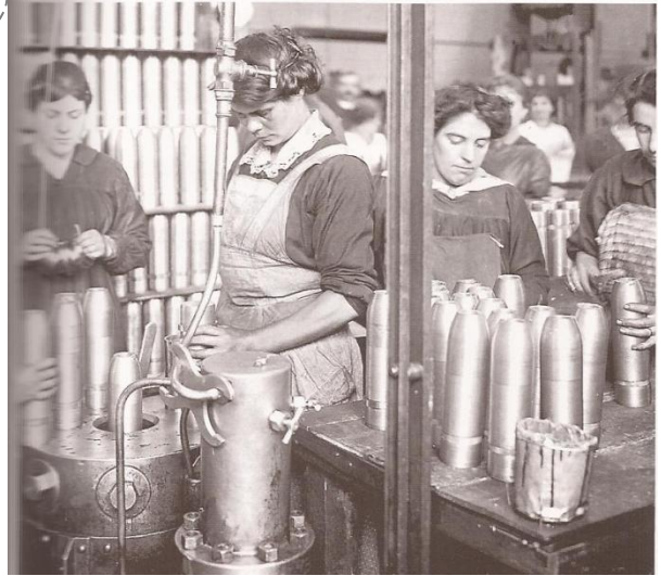
Ouvrières françaises dans une usine de munitions (1914-1918)