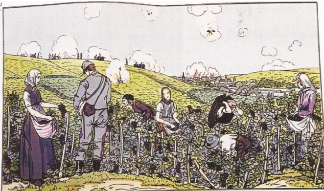
Les vendanges de 1914, gravure