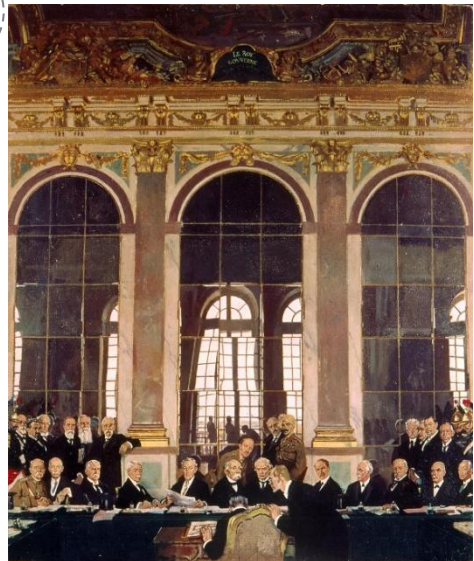
La signature du traité de Versailles (Tableau de W. Orpen, 1919)