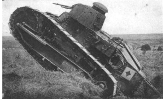
Un char Renault