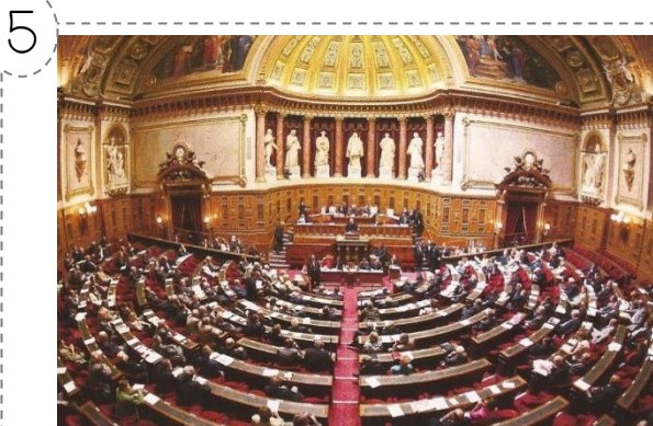
L'intérieur du Sénat

Le pouvoir législatif prépare, discute et vote les lois. Ce pouvoir appartient à l'Assemblée nationale et au sénat. Le pouvoir exécutif fait appliquer les lois. Il est entre les mains du président de la République, du Premier ministre et du gouvernement.