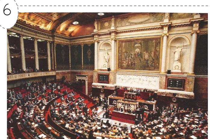
L'intérieur de l'Assemblée nationale

Si le pouvoir exécutif appartient au président de la République, le pouvoir législatif (pouvoir de proposer, discuter et voter les lois) appartient au Parlement, constitué de l'Assemblée nationale et du Sénat.