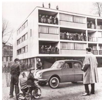
Une rue en 1956

Sous la V ème République, les Français, obtiennent la cinquième semaine de congés payés, le Smic, la semaine de travail de 39 puis de 35 heures. Des indemnités et le RMI (remplacé en 2009 par le RSA) sont accordés aux chômeurs. Sur le plan international, V ème République réussit la décolonisation. Elle achève la réconciliation franco-allemande et entame la construction européenne.