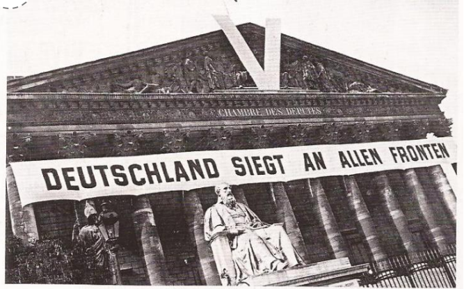
L'Assemblée nationale à Paris portant une affiche de propagande allemande, en 1941 : « L'Allemagne est victorieuse sur tous les fronts ».