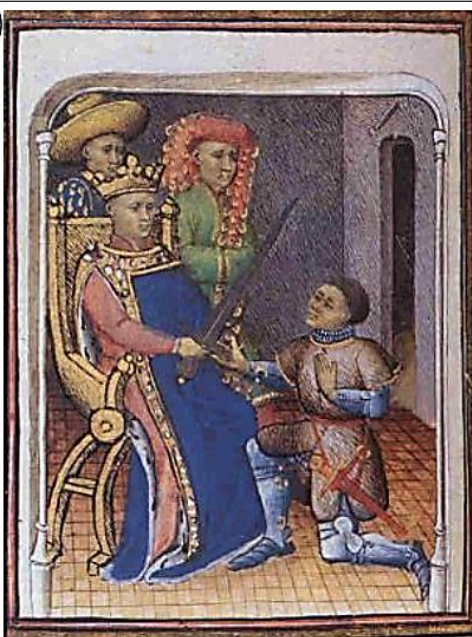
Le roi Charles V fait Du Guesclin connétable, miniature du XV ème siècle.

Du Guesclin est un officier du roi. C'est un chef de guerre habile. En 1370, le roi de France le nomme connétable c'est-à-dire chef des armées française.