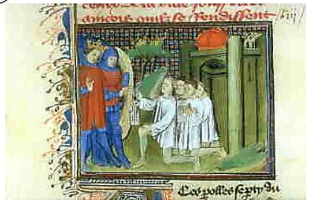
Les bourgeois de Calais, 1347 (Chronique de saint Alban du XV ème siècle)