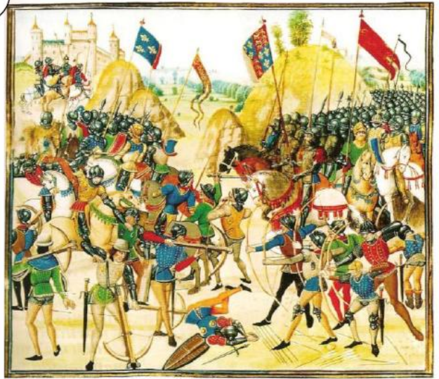
La Bataille de Crécy, 1346 (enluminure du XV ème siècle)

1) D'après le doc.2, quelles armes sont utilisées par les Français à gauche et les Anglais à droite?