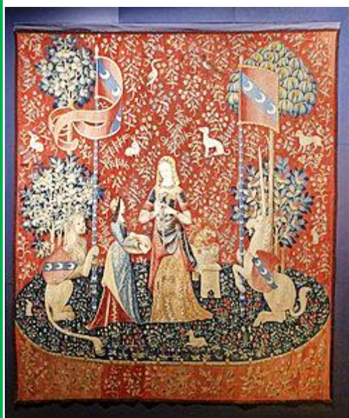
Doc. n° 3 : tenture Dame à la licorne, l'odorat, fin du XV ème siècle