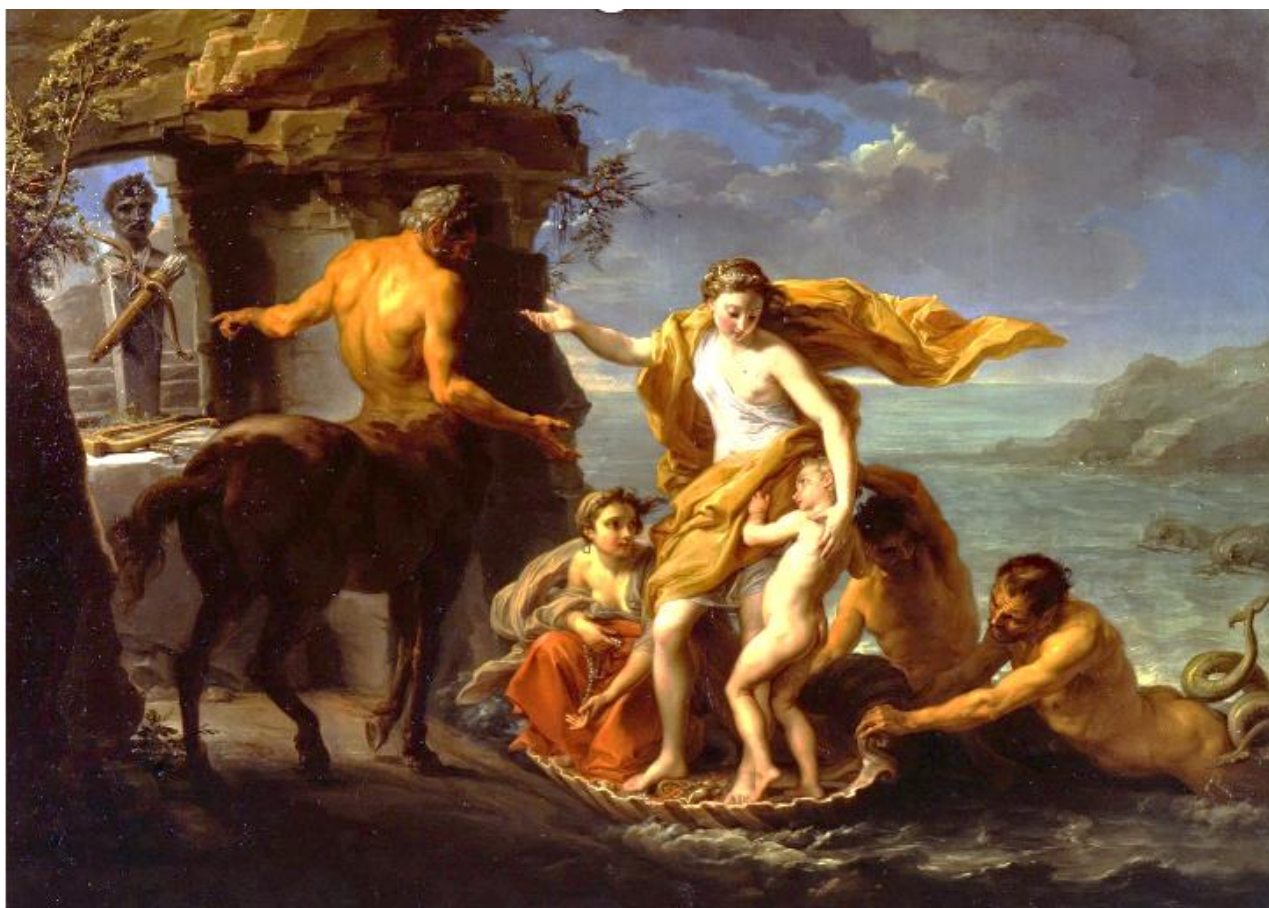
Doc. n° 2 : Achille confié à Chiron , 1760 par Pompeo BATONI