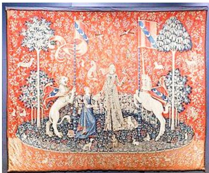
Doc. n°2 : tenture Dame à la licorne, le goût, fin du XV ème siècle