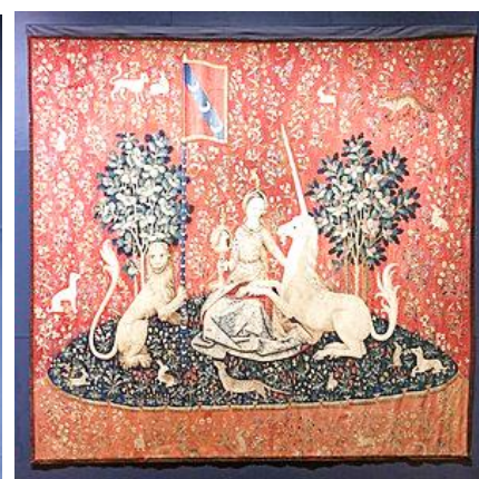
Doc. n° 5 : tenture Dame à la licorne, la vue, fin du XV ème siècle