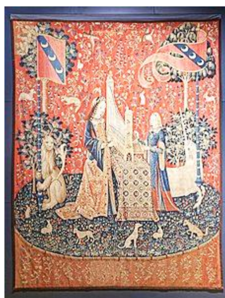
Doc. n° 4 : tenture Dame à la licorne, l'ouïe, fin du XV ème siècle