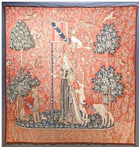
Doc. n° 3 : tenture Dame à la licorne, le toucher, fin du XV ème siècle

Sa corne servirait d'antidote : purifier l'eau, guérir les blessures, neutraliser les poisons.