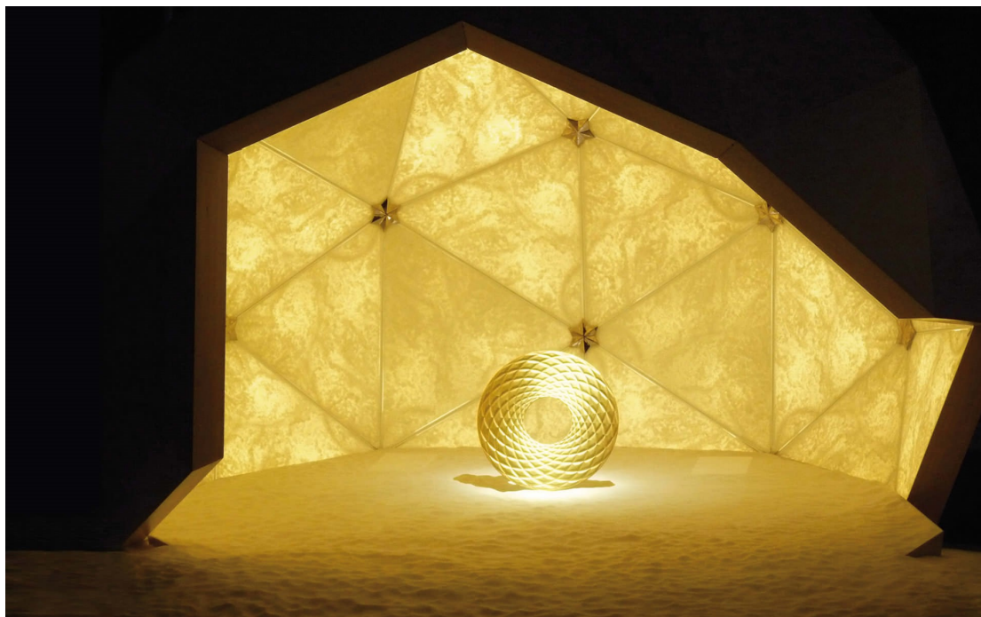
Sylvain Dubuisson Nativité (crèche) - 2011