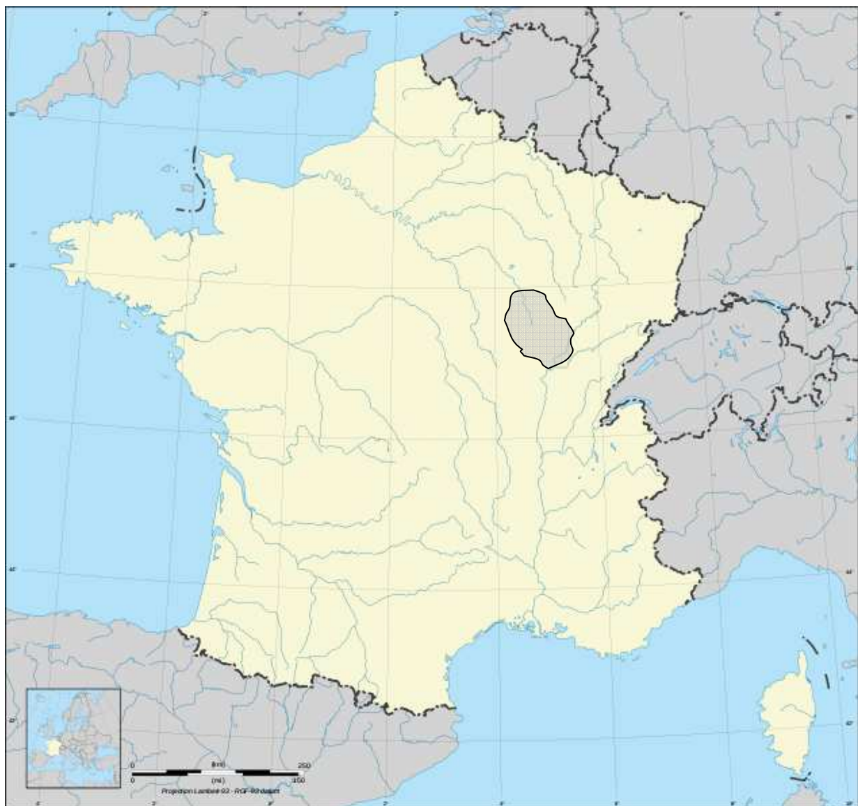
Réseau hydrographique de la France