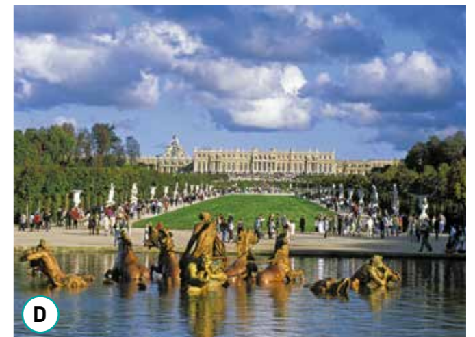
Un palais du XVII e siècle

4 À l'aide des légendes, relie chaque document à sa période.