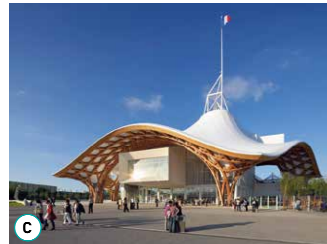
Un musée du XXI e siècle