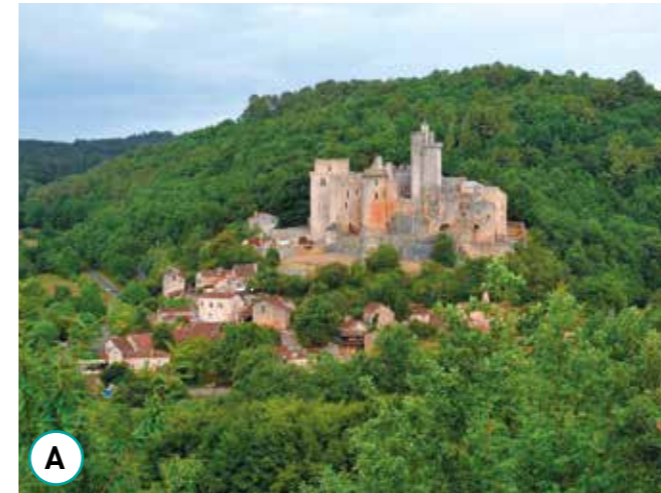
Un château fort du XIV e siècle