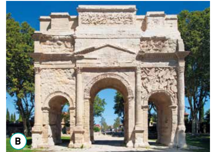
Un arc de triomphe du I er siècle