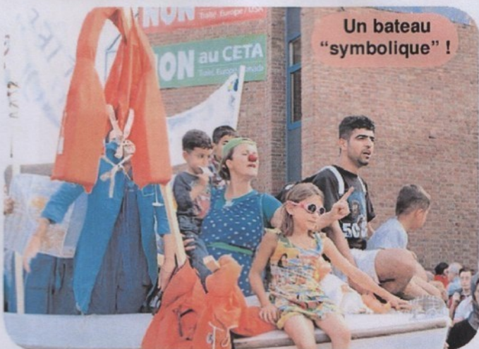
Un bateau "symbolique" !