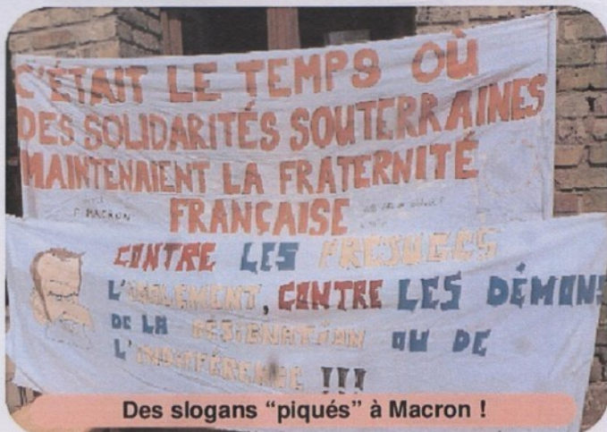
Des slogans "piqués" à Macron !