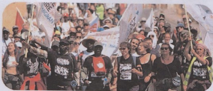
La marche des migrants Vintimille-Londres !