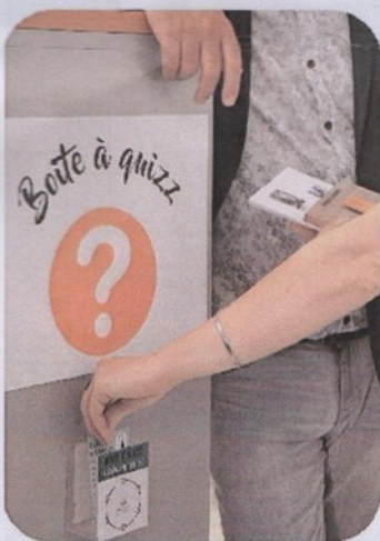
Un des groupes de visite... avec les "socles d'animation" !

(France Nature Environnement), une trentaine de salariés, sociétaires, et partenaires a ainsi visité nos ateliers, de façon ludique, et interactive. Ils ont évolué en groupes, tout au long du parcours ponctué de « boîtes à quizz » et de « kiosques de démontage » d'ordinateurs et smartphones. Enfin, ils se sont réunis pour un pot de l'amitié.