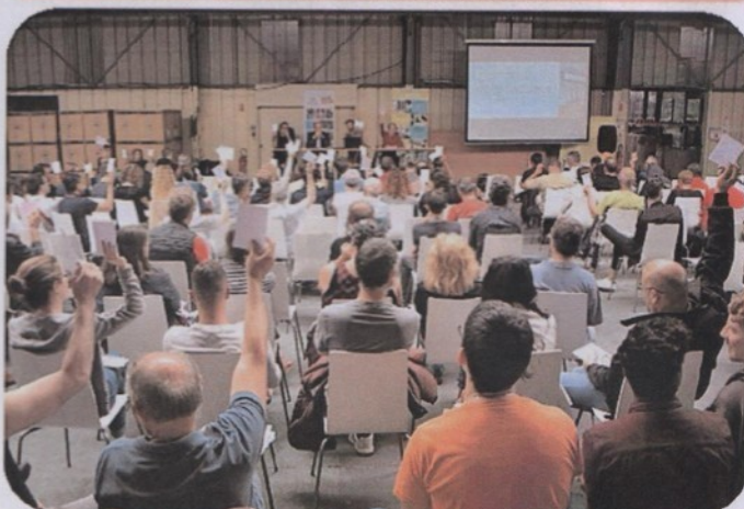
Assemblée Générale des ADB