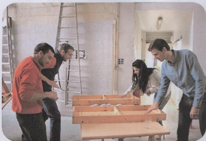
Après l'AG : animation jeux en bois !