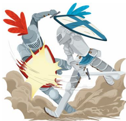
Bataille de chevaliers

La guerre est la principale activité des chevaliers. Ils aiment se battre et ensuite raconter leurs actes de bravoure. En dehors de la guerre, ils pratiquent la chasse ou participent à des tournois qui ressemblent à des batailles.