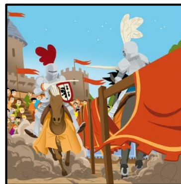
Partie de joute équestre

Lorsqu'il part au combat, les chevaliers portent une cotte de maille métallique, qui couvre presque le tout le corps. Ils se protègent la tête avec un casque en métal, le heaume et le corps avec un long bouclier, l'écu. Ils ont deux armes offensives : la lance et la longue épée à double tranchant.